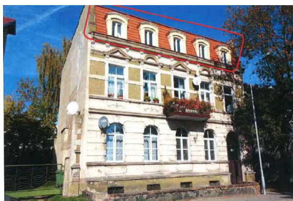
Widok elewacji frontowej – ul. Izerska 6

Pierwszy przetarg ustny nieograniczony na sprzedaż przedmiotowej nieruchomości został przeprowadzony w dniu 18 marca 2019 roku zgodnie z ogłoszeniem z dnia 08 lutego 2019 roku i zakończył się wynikiem negatywnym z uwagi na brak osób zainteresowanych